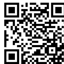
報名網址 QR CODE