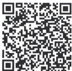
診所報名 QR 碼