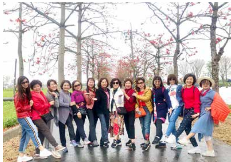
▶ 姐妹們開心的齊步走