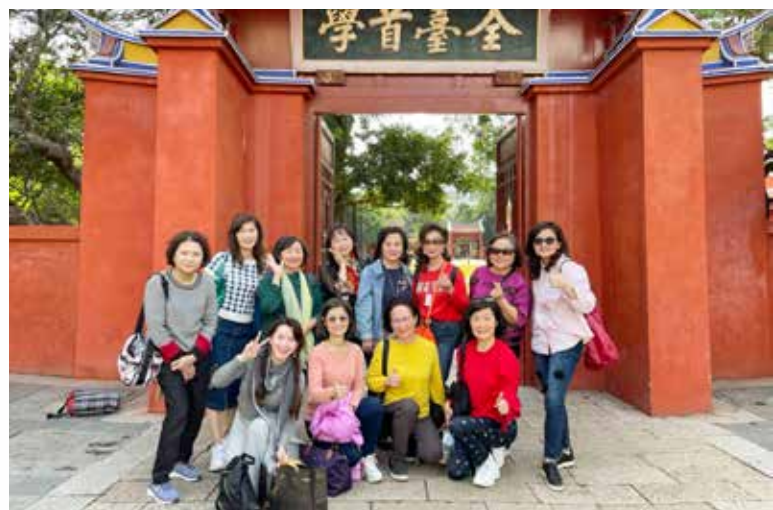
▶ 全臺首學～台南孔廟