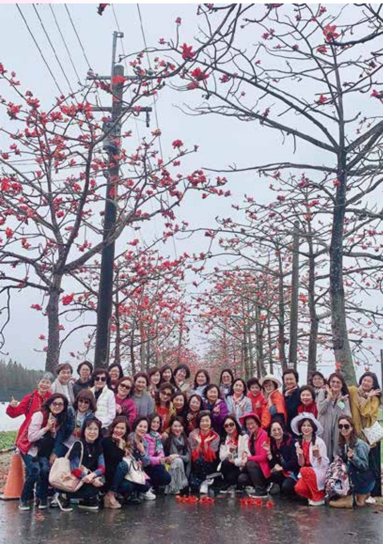
◀ 細雨紛飛下的林初埤步道

第二站是《台南美術館》，美術館一館是由台南警察局變身，古老與創新兩種建築風格完美的結合一體，更因林志玲的婚禮而風靡一時。當天展出「再現傳奇 - 洪通百歲紀念展」，洪通是台灣畫史上重要的社會象徵意義，他代表一個鄉野樸素、未經學院訓練的素人畫家，藉由對創作的熱情與決心，傳奇性的獲得廣大的成功與回響。